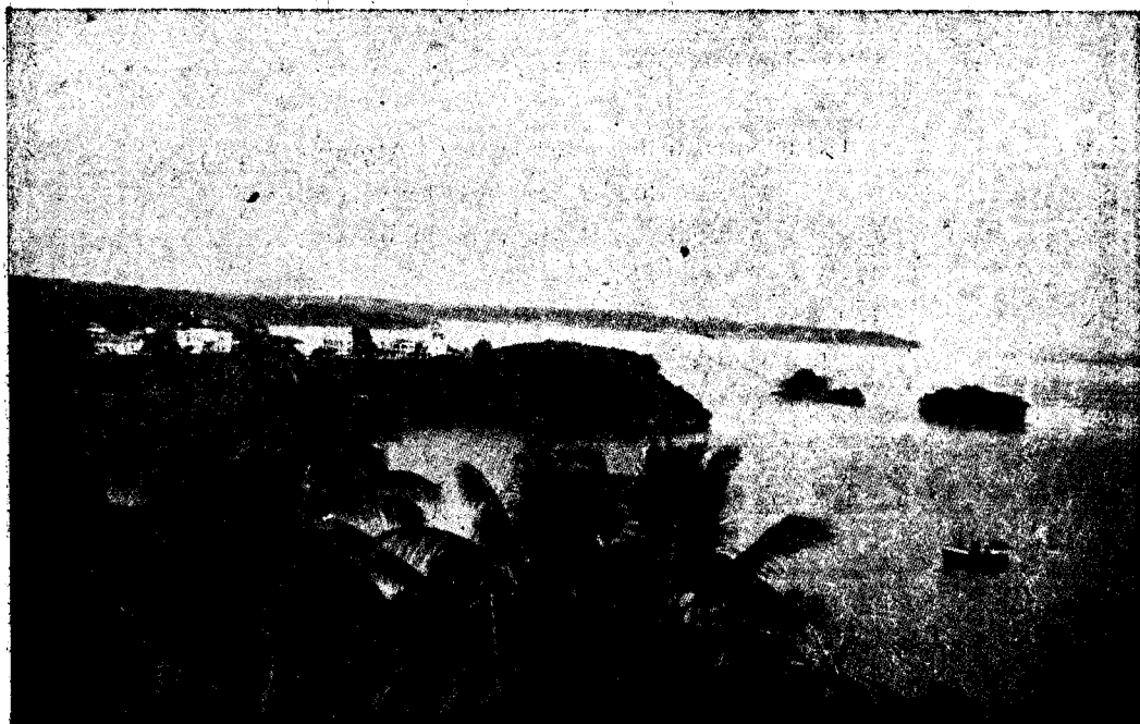
Santa Isabel--Vista general hasta punta Europa