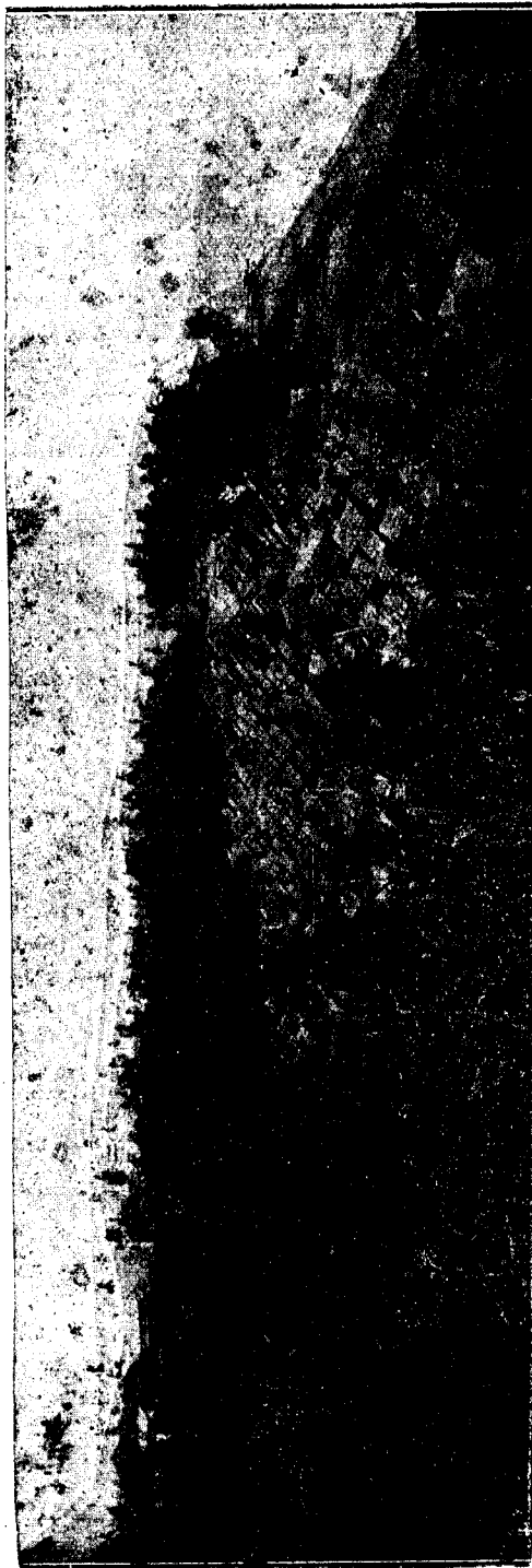
Poblado antiguo de Annobón

Como dibujante habilidoso que era, trazó el plano del poblado, con anchas calles, bien