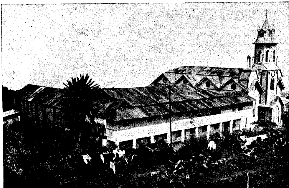
Basilé. Noviciado de Oblatas e Iglesia