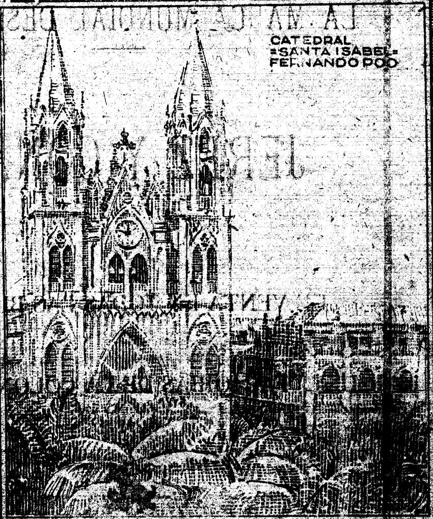
CATEDRAL = SANTA ISABEL = FERNANDO POO