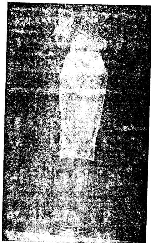
N a . S a . del Pilar Patrona de las Españas

¡Anet trono sencillo, hasta el cobarde es coloso!