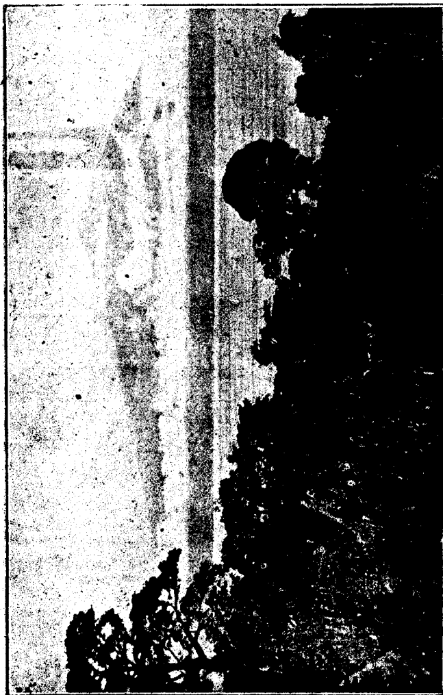
PICO DE CAMERON (Visto desde Santa Isabel)

Año XXXVIII—Santa Isabel 25 de NOVBRE. de 1943—Núm. 1162