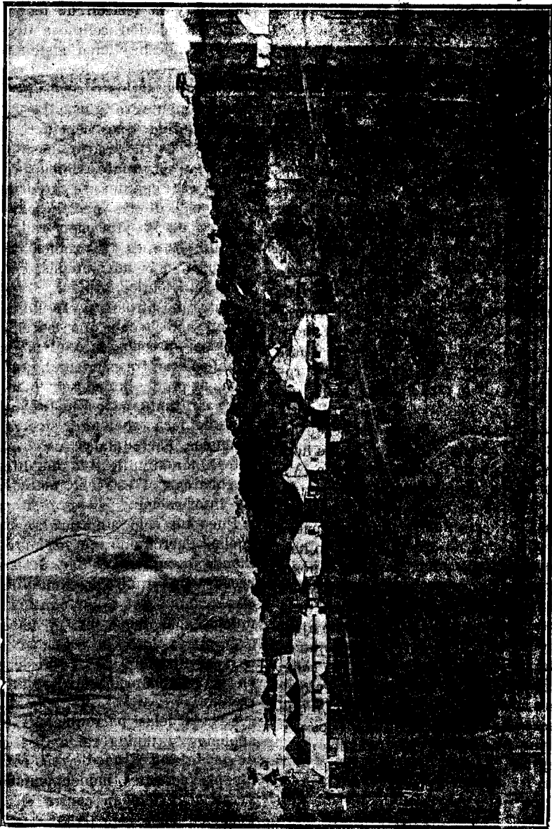
Vista de Basíle en tiempo de los Colonos.

SUMARIO. Portada, nuestro grabado—Santorial y Santo Evangelio—Las escuelas Parro- quiales—Cutivo del Ananá. Resumen del B. O. de 1 de febrero—Noticias de la Colonia de Sta. Isabel—Radios de Prensa—Cámara Agrícola, Aviso—Pasaje llegado en el Plus—Ultra.