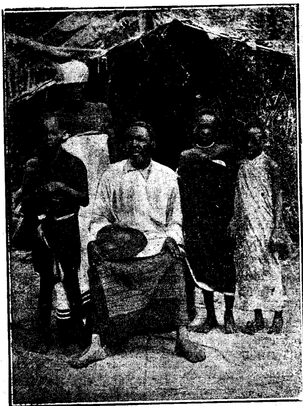
FAMILIA DE LA TRIBU BAPUKU (CABO SAN JUAN)

Santa Isabel (Fernando Poo) 10 Septiembre 1924