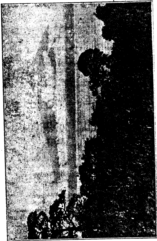
Vista panorámica del próximo Continente tomada desde nues- tra isla; en el fondo aparece el macizo M'ngoma-Lobat del Camerón.

Precio de subscripción: en la Colonia, 10 ptas. al año. — Fuera de la Colonia, 12 id. Certificada id id. 17'50 id. id. id. — certificada 20' id. Número suelto 0'50 atrasado una peseta. — Existen Colecciones