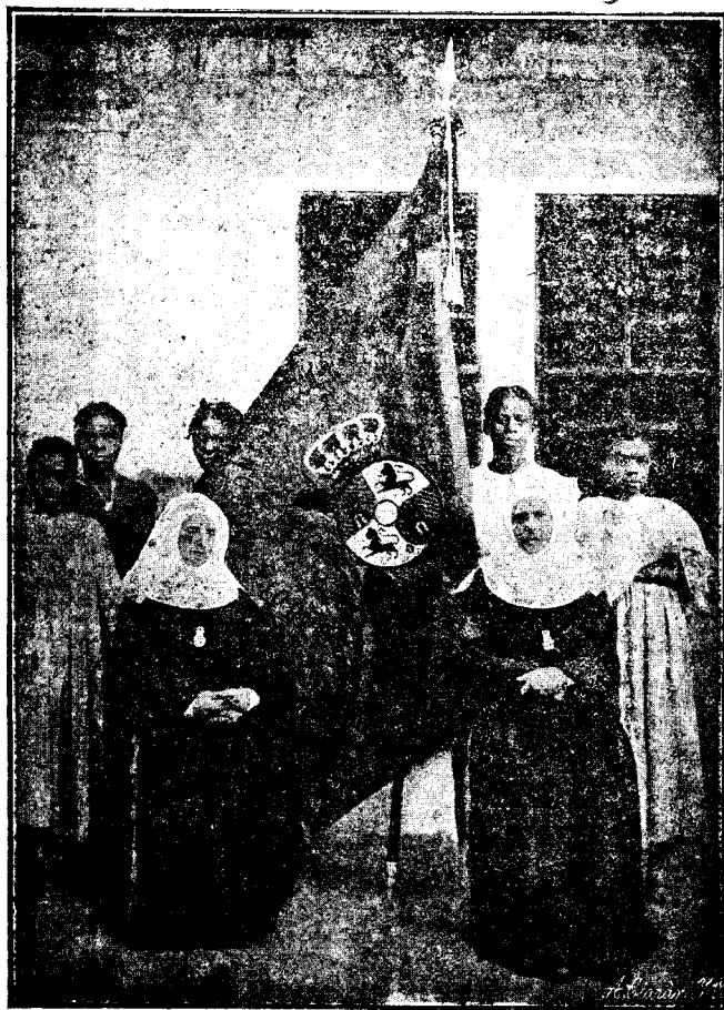
La Bandera de la Guardia Colonial.

-CASA CENTRAL - CALLE SACRAMENTO, Nº 10-