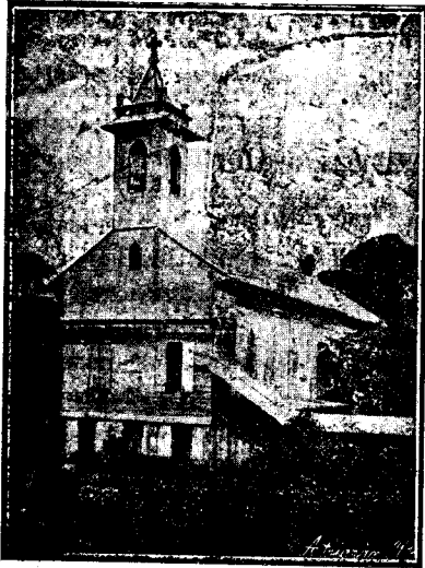
Iglesia de Concepción