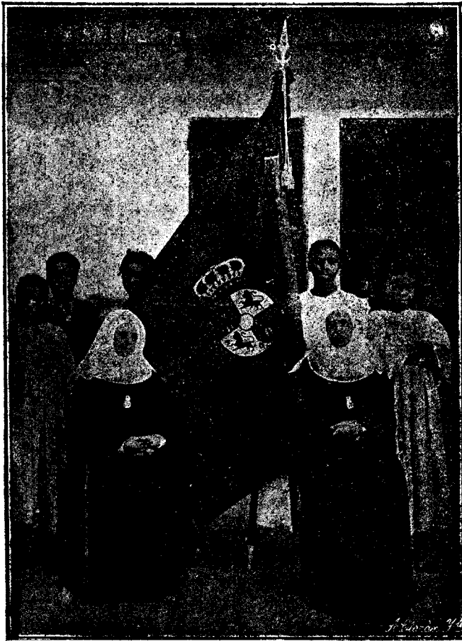
GRABADO = ARTÍSTICA BANDERA DE LA GUARDIA COLONIAL. TRABAJADA POR LAS RELIGIOSAS DE LA I.D.A. CONCEPCIÓN Y SUS EDUCANDAS DE BASILÉ.

trips , permitirá obtener una producción normal.