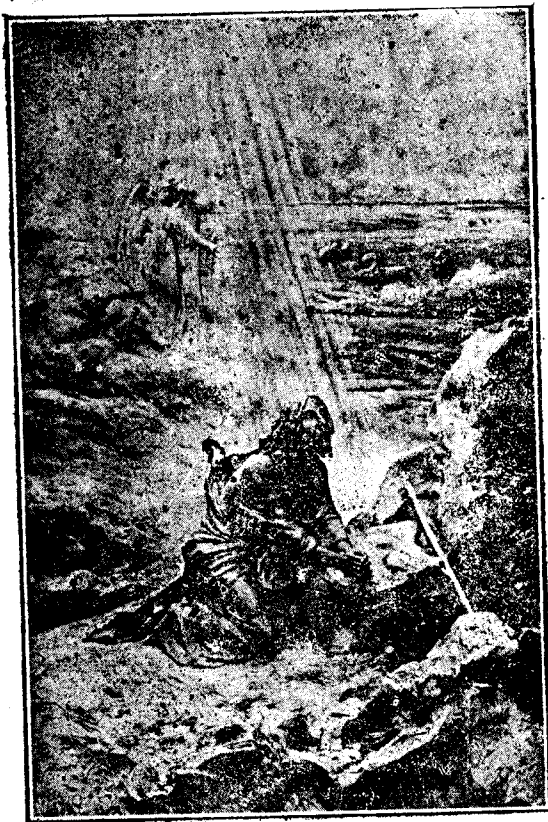
Jesús orando en el huerto.

D. Juan Bautista Aznar: el nuevo ministro nació en Coruña en Septiembre de 1866 fué tercer comandante del Infanta María Teresa cuando el combate de Santiago de Cuba: ayudante mayor del ministerio de Marina; comandante del acorazado Alfonso XIII ; general jefe de la división de instrucción y comandante general de la Escuadra desde el 23 de Julio 1921. Su gestión al frente de ésta ha constituido para el general Aznar, con motivo de los sucesos de Marruecos, un verdadero timbre de gloria.