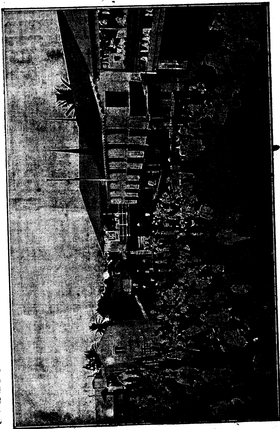
1905. Festejos celebrados con ocasión de las Bodas de S.M. el Rey, (3.D.G.) -A la derecha se ve la antigua casa-Gobierno y la Vigatana.

AÑO XX Santa Isabel (Fernando Poo) 25 de Enero de 1923 Num. 537