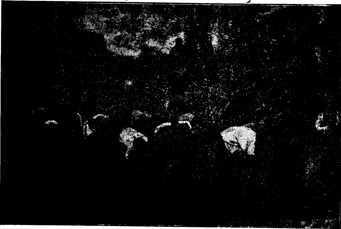
Braceros chapeando una finca de cacao