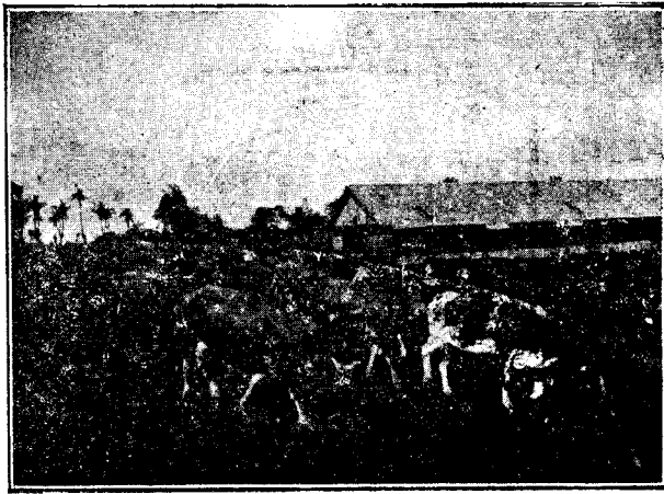
MOKA: POTRERO DE LA COMPAÑIA TRASATLÁNTICA