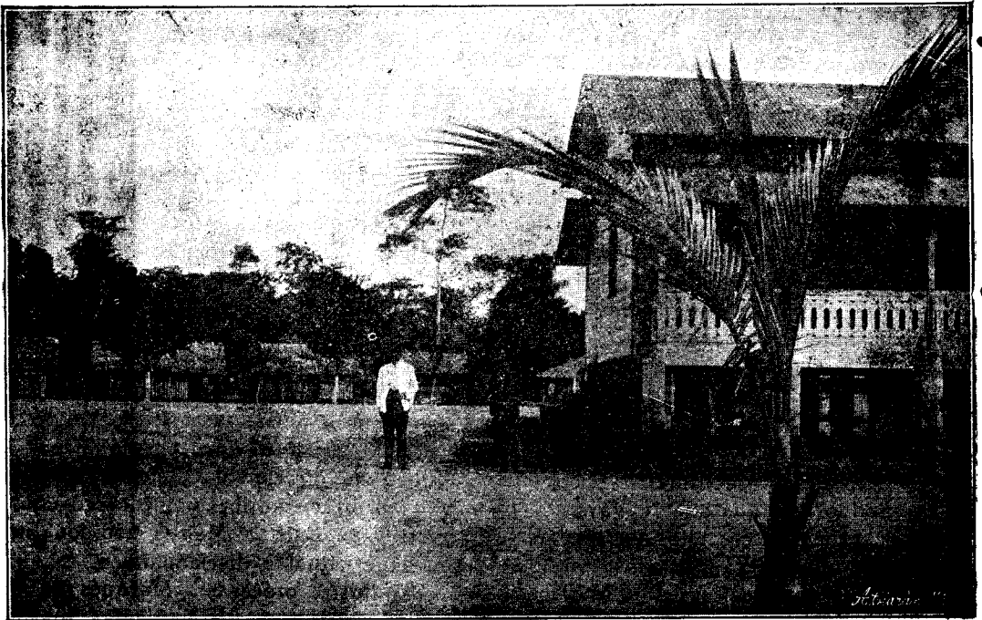
Campamento de Asobla (Río Utamboni)

Con todo este espíritu el Gobierno se siente robustecido y muy optimista, lo que tanto más nos agrada cuanto que vemos cómo acepta la colaboración de la Iglesia. Primero movilizó a los capellanes castrenses y ahora ha incorporado a los Hospitales militares a las Hermanas de la Caridad que sin delantales de encajes ni brazaletes alegóricos van a sufrir al lado de los heridos y enfermos. Ha aceptado también el generoso ofrecimiento de los hermanos Hospitalarios de S. Juan de Dios para ir a la línea de fuego: y del mismo modo se han ofrecido los Franciscanos y demás Ordenes religiosas, pues tienen sobradamente acreditado su noble patriotismo en las grandes crisis de la patria, aportando desinteresadamente el sacrificio de su vida cuando lo ha requerido el honor nacional y la independencia del país.