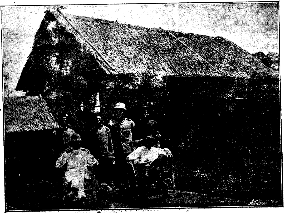
OFICIALES ESPAÑOLES EN EL CAMPAMENTO DE INTERNADOS DEL KAMERUN DURANTE LA GUERRA.

El totem familiar tiene el mismo origen que el de la tribu y así pueden ser origen del mismo un favor importante, un hecho singular que llame poderosamente su atención y no se sepan explicar, la notable familiaridad de un animal que constantemente visite sus viviendas y siempre cariñoso, fiel e inofensivo, en el cual descubre algún vidente consultado simpatías sobrenaturales hacia la familia visitada, a las cuales es preciso corresponder.