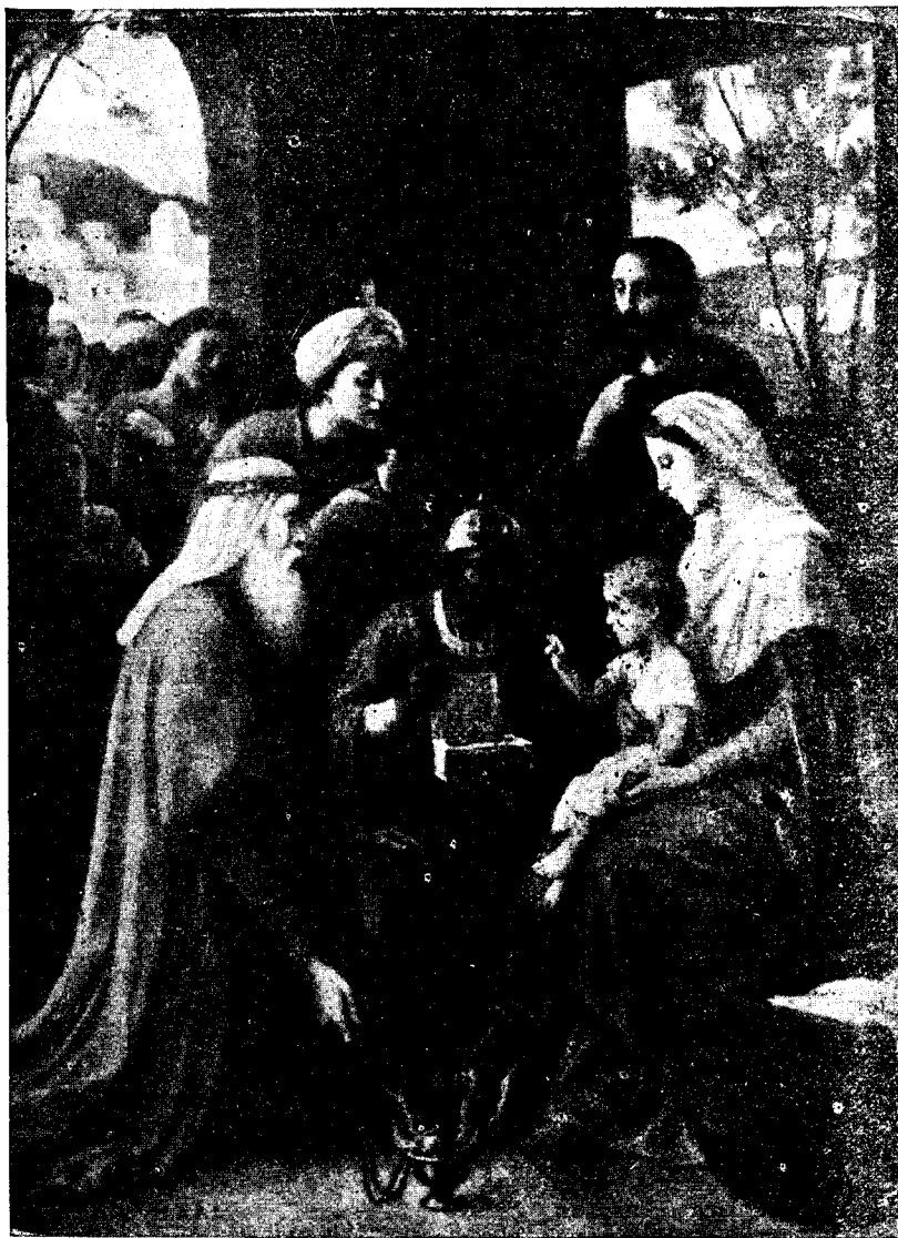
Adoración de los Santos Reyes

Año XVIII Santa Isabel (Fernando Poo) 10 Enero 1921 Núm. 489