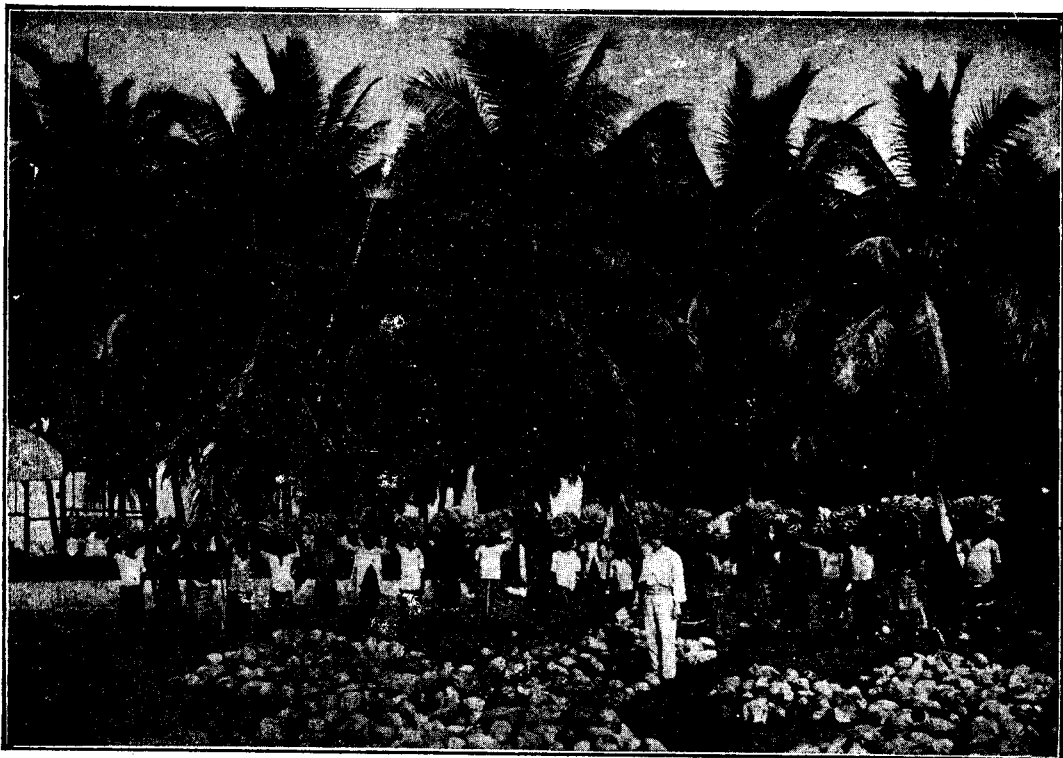
LA FINCA „S. ANTONIO” PROPIEDAD DE LA COMPAÑIA TRASATLÁNTICA—GRUPO DE BRACEROS CARGADOS DE SENDOS RACIMOS DE BANANAS PARA EL VAPOR CORREO; A SUS PIES SE VE UN ENORME MONTÓN DE COCOS, COGIDOS EN LA MISMA FINCA.