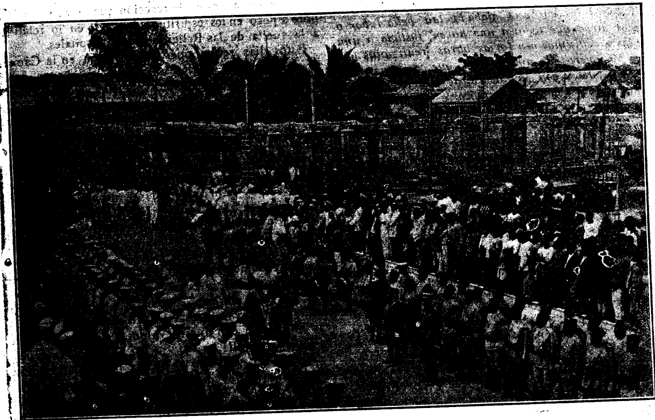
Arenya a los soldados por el ilustrísimo señor Vicario apostólico después de terminar la jura de la bandera.

La preciosa bandera con la que justamente se engullece la Guardia Colonial le fué regalada por la Colonia, por iniciativa del Consejo de Vecinos. Aunque hubo partidarios de encargar su confección a España, prevaleció el parecer de los más, de que se hiciera en la Colonia y en ella tomaran parte las hijas del país. Naturalmente que se fijaron los ojos en las Rdas. Madres Concepcionistas que tan admirablemente bien enseñan esta clase de labores a las hijas del país. Ardua era la empresa y erizada de dificultades mil atendidos los insignificantes medios de que aquí se puede disponer, Así y todo,