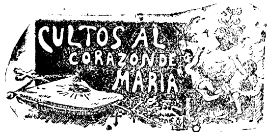
La fiesta del Corazón de María en Basile.

Claro que debe cuidarse mucho que las cosechas no se extiendan demasiado con perjuicio del cafeto, y es regla ordinaria suspenderlas desde el segundo año.